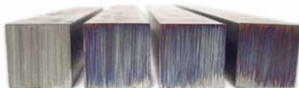
Cubitron™ II 984F 36+ Другая лента 1 Другая лента 2 Другая лента 3

Шлифленты 3M™ Cubitron™ II устанавливают НОВЫЕ СТАНДАРТЫ скорости шлифовки, качества обработки поверхности, и срока службы шлифовальных лент